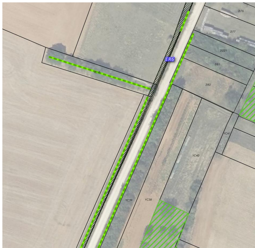
ER6 Partie centrale