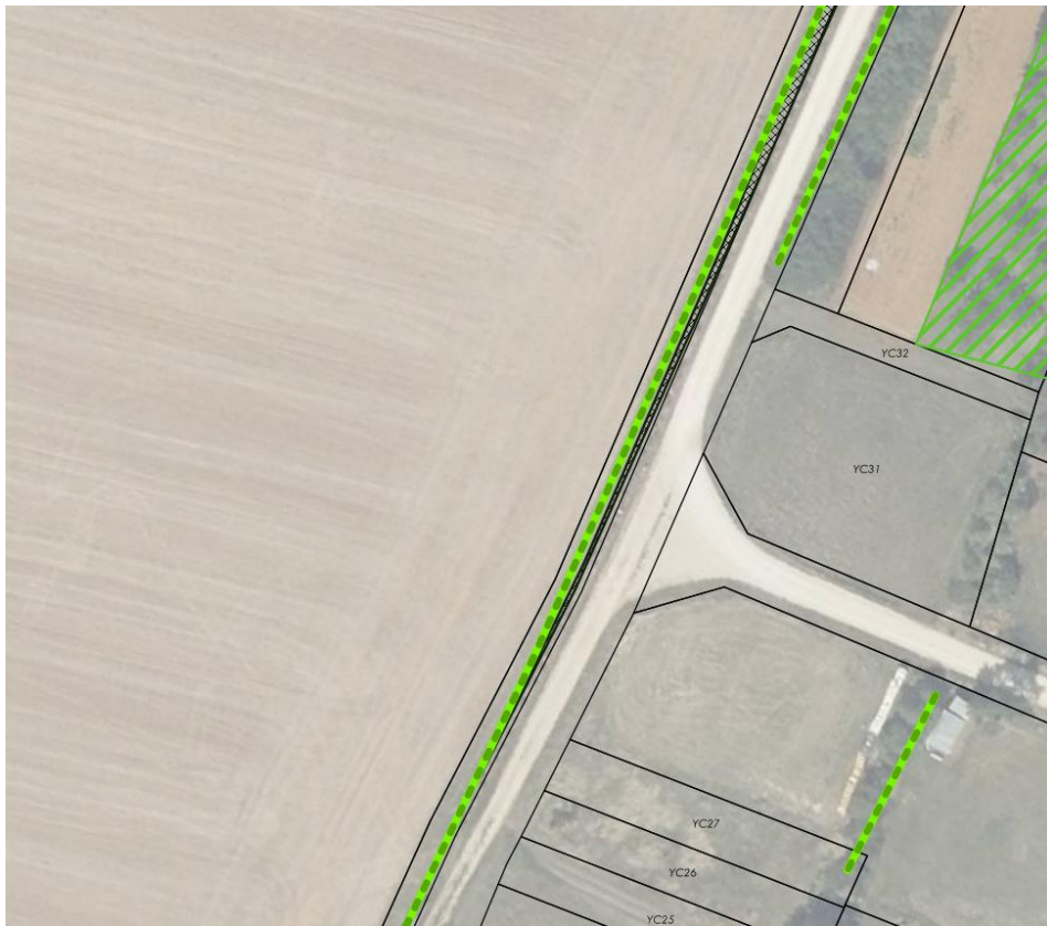
ER6 partie basse