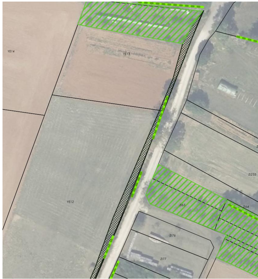
ER6 Partie haute